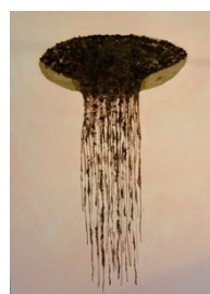
Bente Lyhne: Erindring II